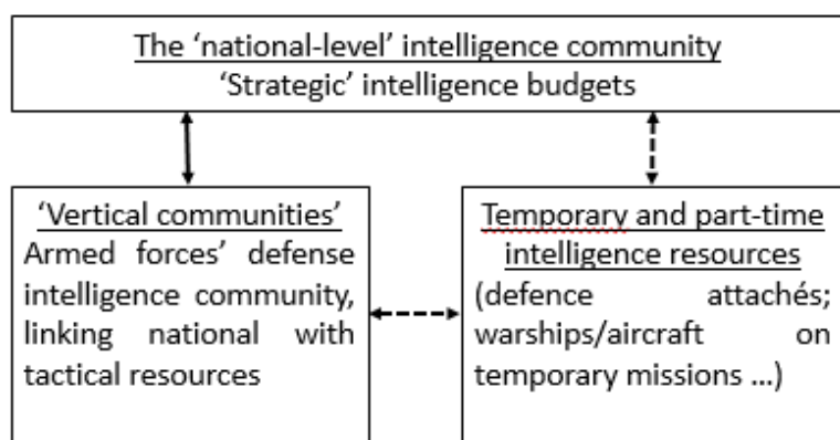
Total intelligence activities

Il est intéressant de percevoir les structures de renseignement militaire telles que présentées dans le modèle des total intelligence activities 10 , qui reconnaît que le lien entre les services de renseignement et de sécurité est une interconnexion aux contours poreux constituée de trois ensembles : une couche horizontale, celle des agences de niveau national (comme le SGRS) ; des piliers verticaux, qui lient ces agences à des ressources de collecte tactique (comme le sont les structures de renseignement des forces armées) ; et des moyens de collecte temporaire ad-hoc.