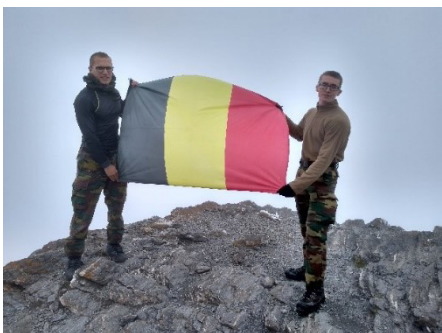
Een gevoel van overwinning tussen de mistige bergtoppen van de Alpen