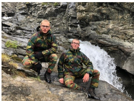
Een pauzemoment in de Alpen