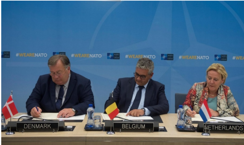
Figuur 1 - Ondertekening van de Memorandum of Understanding door de Defensie ministers van Nederland, Denemarken en België

Op 16 februari 2017 ondertekenen de Defensie ministers van België, Denemarken en Nederland de Letter of Intent (LoI) en op 7 juni 2018 ondertekenen ze het Memorandum of Understanding (MoU) om het C-SOCC op te richten. Op 25 maart 2019 wordt het Technical Agreement (TA) ondertekend tussen het NSHQ en de drie Special Operations Commands (SOCOM) , wat de eigenlijke start betekent van het C-SOCC.