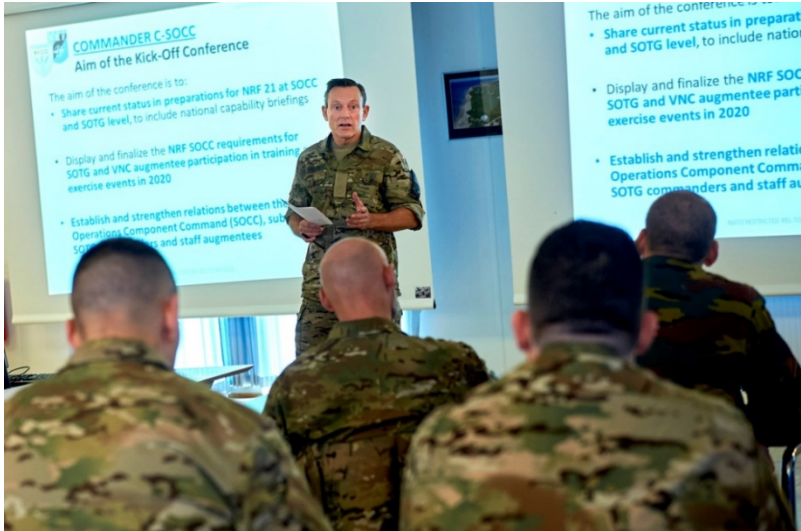
Figuur 3 – De Deense Generaal-majoor Peter Boysen, commandant C-SOCC, spreekt de staf van het C-SOCC toe tijdens de NRF SOCC 21 Kick-off Conference

Planning Process (NDPP) 2 . Door haar deelname aan het C-SOCC voldoet België aan het huidige opgelegde target inzake SOF C2.