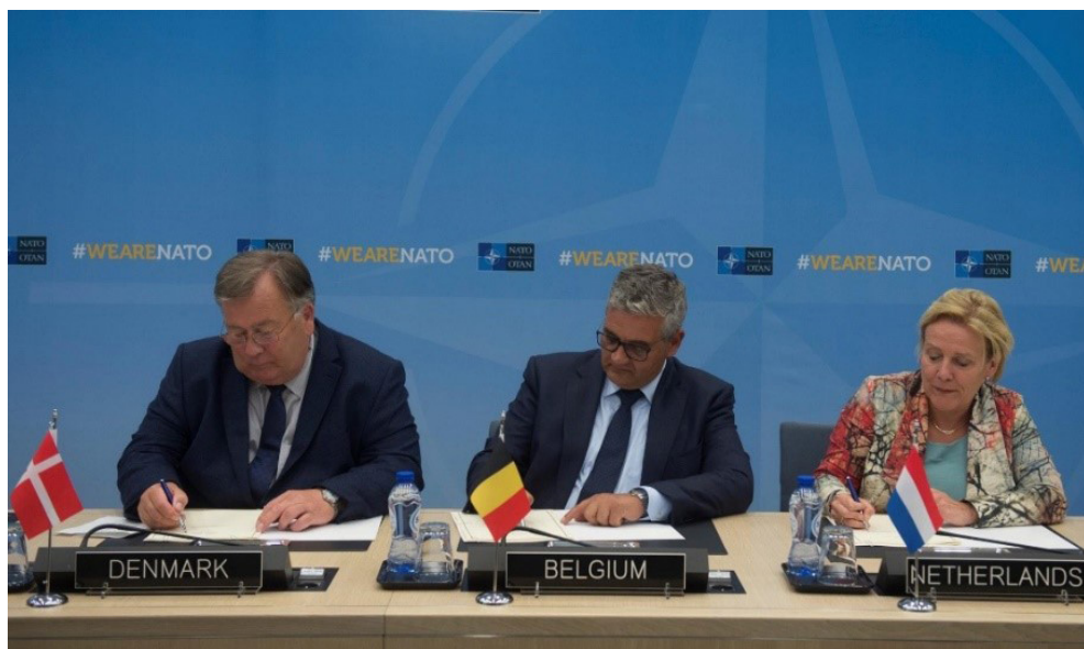
Figuur 1 - Ondertekening van de Memorandum of Understanding door de Defensie ministers van Nederland, Denemarken en België

Op 16 februari 2017 ondertekenen de Defensie ministers van België, Denemarken en Nederland de Letter of Intent (LoI) en op 7 juni 2018 ondertekenen ze het Memorandum of Understanding (MoU) om het C-SOCC op te richten. Op 25 maart 2019 wordt het Technical Agreement (TA) ondertekend tussen het NSHQ en de drie Special Operations Commands (SOCOM), wat de eigenlijke start betekent van het C-SOCC.