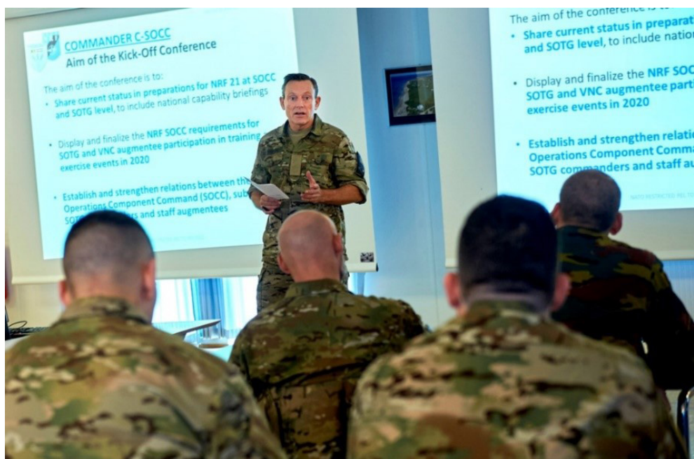
Figuur 3 – De Deense Generaal-majoor Peter Boysen, commandant C-SOCC, spreekt de staf van het C-SOCC toe tijdens de NRF SOCC 21 Kick-off Conference

De bundeling van de drie nationale bijdragen aan het C-SOCC resulteert in een operationele capaciteit die de som van de individuele nationale capaciteiten overstijgt. Zo draagt het C-SOCC tevens bij tot het versterken van de nationale SOF-capaciteiten. SOF C2 is ook hernomen als NATO Capability Target voor België in het kader van het NATO Defense Planning Process (NDPP) 2 . Door haar deelname aan het C-SOCC voldoet België aan het huidige opgelegde target inzake SOF C2.